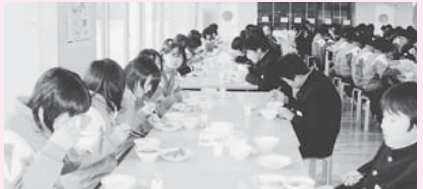
▶ 地元食材での学校給食を実施中の美里中学校