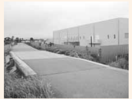
▲老朽化し、早期改修が求められる白塚・河芸地区海岸堤防