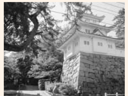
▲お城の価値を上げるためにハード・ソフト両面の整備を