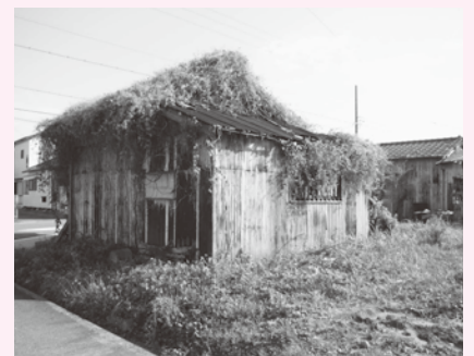
▲管理不全により著しく保安上危険で衛生上有害な老朽家屋