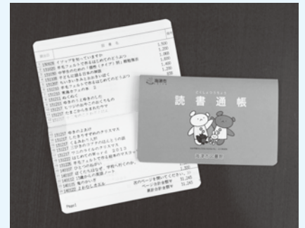
▲「読書通帳」で読書推進を