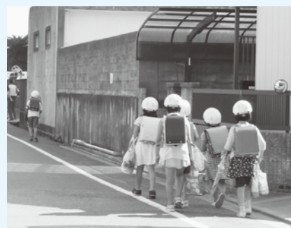
▲すべての子どもには平等に学び育つ権利がある