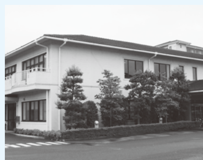
▲津市福祉避難所の周知と拡充を図れ