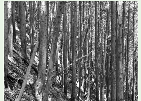
▲整備が待たれる、植林後に放置された森林