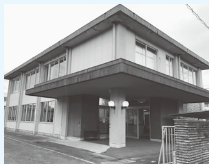
▲使用料を据え置き、地域を活性化させるための公民館を