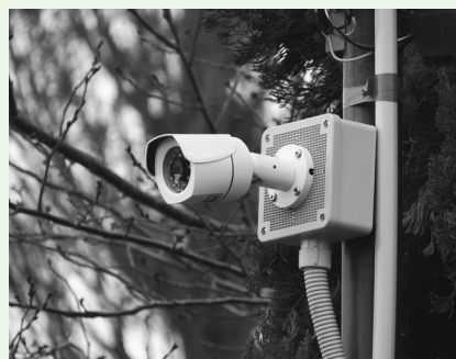
▲申請者にとってわかりやすい防犯カメラ補助金制度を