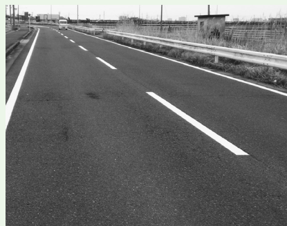
▲歩行者の安全確保等のため市道区画線の適切な維持管理を