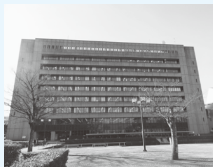
▲市役所は一刻も早い真相究明と市民へ説明責任を果たせ